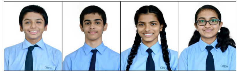
ओरायन स्कूल (आयसीएसई) शाळेचे गुणवंत विद्यार्थी