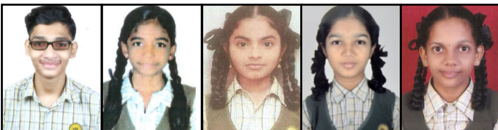
श्री.माधवराव भागवत हायस्कूल(मराठी माध्यम) शाळेचे गुणवंत विद्यार्थी