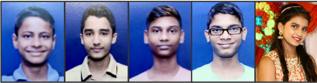
प्रार्थना समाज हायस्कूल शाळेचे गुणवंत विद्यार्थी