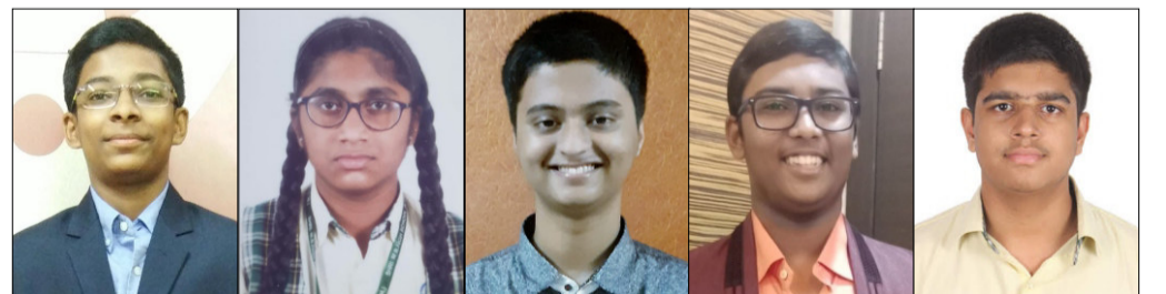
श्री.माधवराव भागवत हायस्कूल(इंग्रजी माध्यम) शाळेचे गुणवंत विद्यार्थी