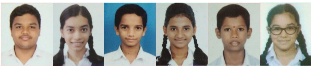
परांजपे विद्यालय शाळेचे गुणवंत विद्यार्थी