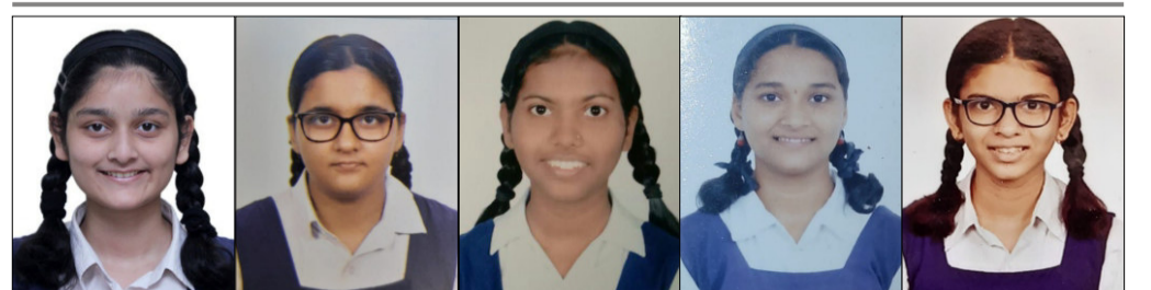
पार्ले टिळक विद्यालय ( मराठी माध्यम) शाळेचे गुणवंत विद्यार्थी