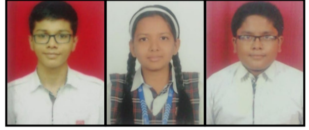
पार्ले टिळक विद्यालय (इंग्रजी माध्यम) शाळेचे गुणवंत विद्यार्थी