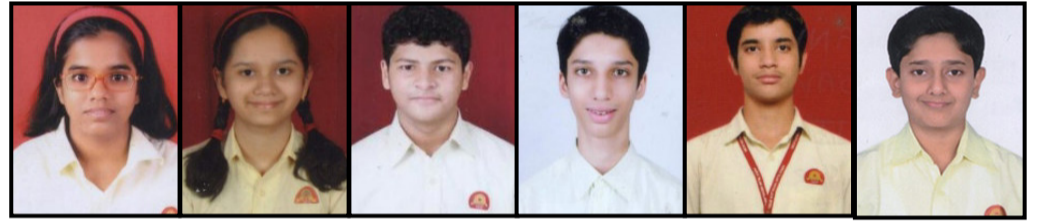
पार्ले टिळक विद्यालय (आयसीएसई) शाळेचे गुणवंत विद्यार्थी