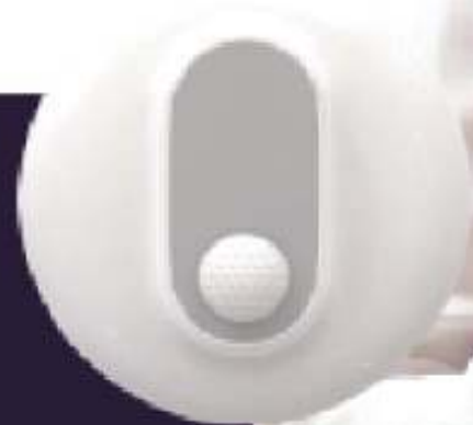
Detect Human Body Only *