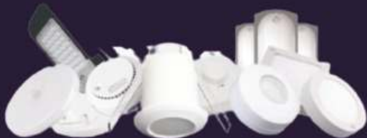
SENSORS & SMART LIGHTS

Distributors/ Dealership- Trade enquiries solicited