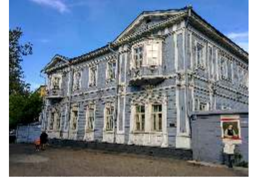
Siberia म्हणायला सुरुवात केली. पण सर्वात महत्वाचं म्हणजे तिने ह्या वैराण प्रदेशात संगीत पान ९ वर