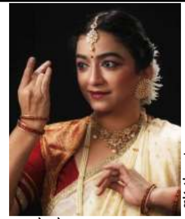
पान ५ नृत्य हेच जीवन