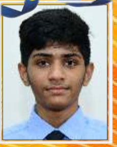
संकेत नाबर ९९.२०%