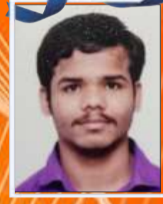
गणेश माने ७३.००%