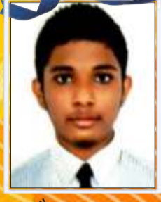
कौशल्य कदम ८३.००%