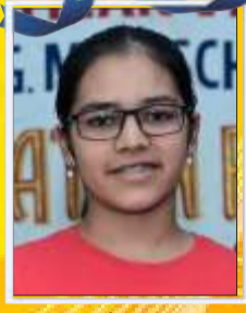
श्रावणी तरसे -९९.४०%