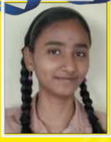
प्राची वेलन ६५.८०%