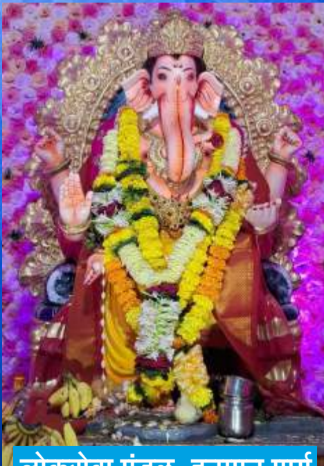
लोकसेवा मंडळ, हनुमान मार्ग