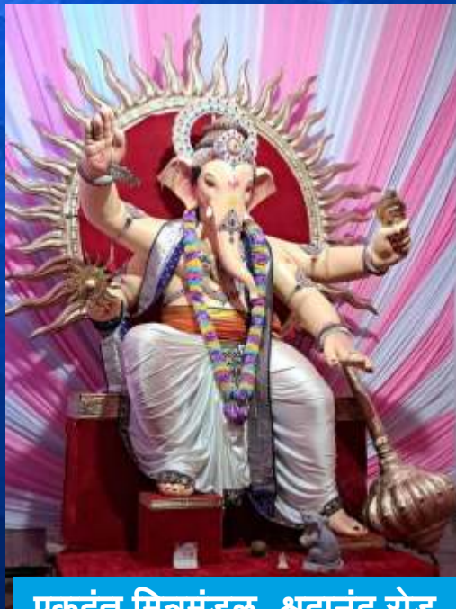
एकदंत मित्रमंडळ, श्रद्धानंद रोड