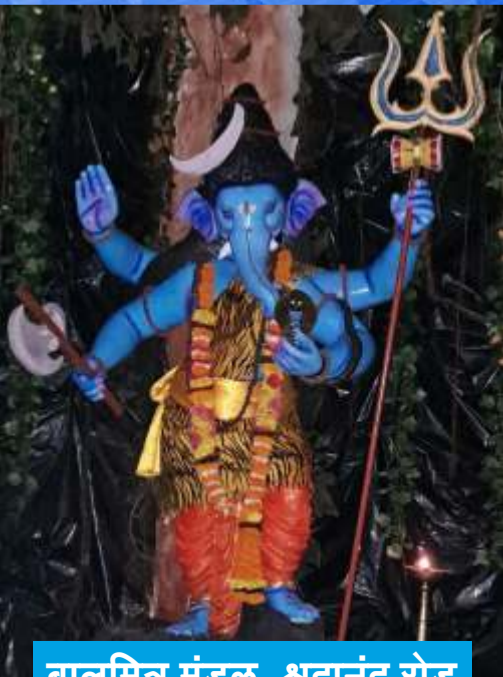
बालमित्र मंडळ, श्रद्धानंद रोड