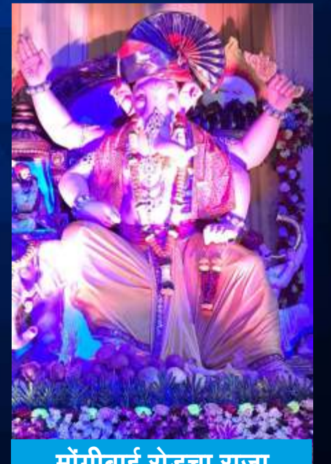
मोंगीबाई रोडचा राजा