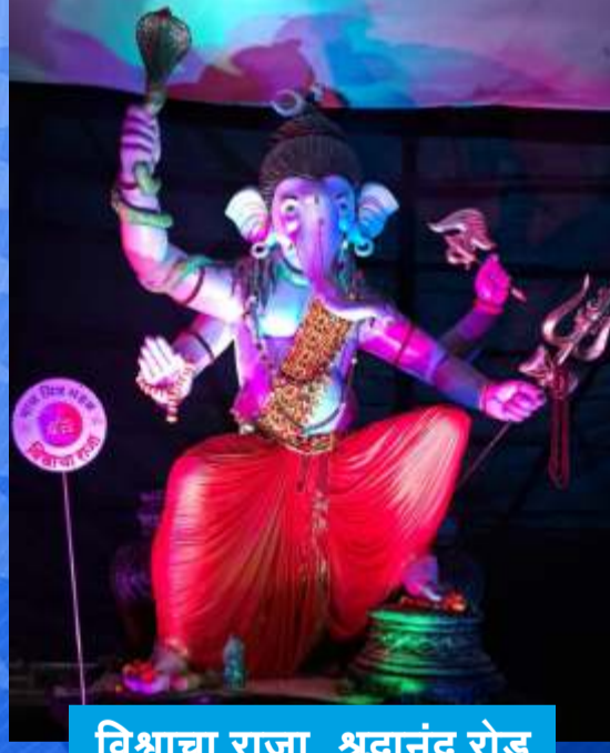
विश्वाचा राजा, श्रद्धानंद रोड