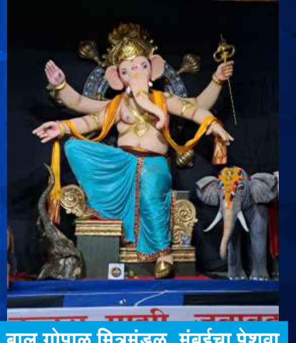
बाल गोपाळ मित्रमंडळ, मुंबईचा पेशवा