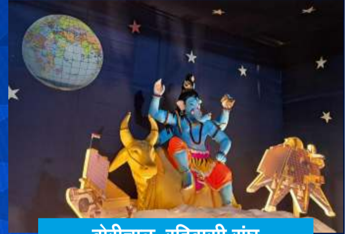
बोरीचाल रहिवासी संघ