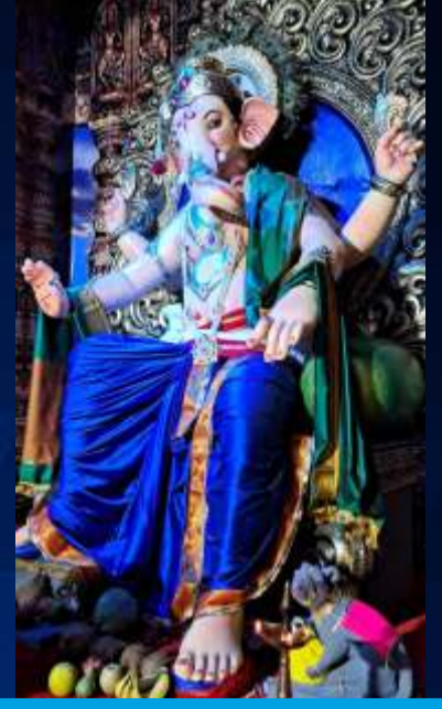
नवयुग मित्रमंडळ, विलेपार्लेचा मोरया