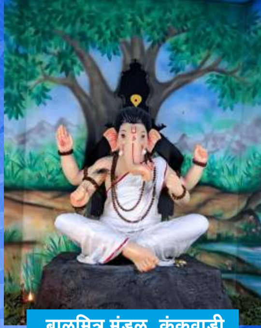
बाळमित्र मंडळ, कुंकूवाडी