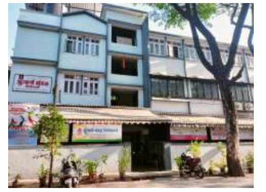
पान ४ निरपेक्ष समाजसेवेची, गाथा उत्कर्षाची

पान ११ उत्कट एकल नाट्याविष्कार - 'सांगत्ये ऐका'